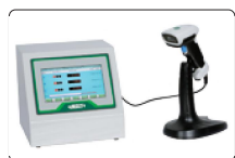
扫码枪输入产品编码功能 (定制)